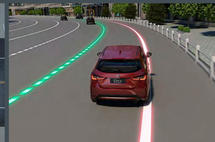
RDM™ Sistema para Mitigação de Evasão de Pista 5

Sistema de assistência automática de farol alto, que se ajusta de acordo com a situação.