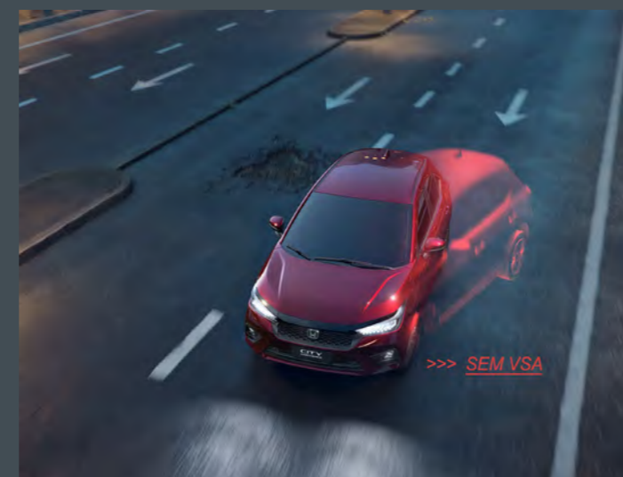
VSA - Assistente de estabilidade e tração