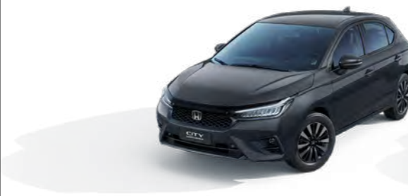
Cinza Basalto Metálico