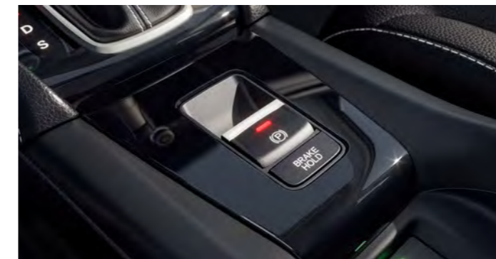
Freio de estacionamento eletrônico com função Brake-Hold

Mantendo a visibilidade e contribuindo para a segurança, o novo sensor automático de chuva em conjunto com o limpador de para-brisa com função intermitente garantem maior comodidade a bordo.