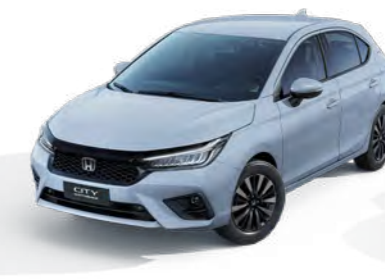
Cinza Grafeno Perolizado