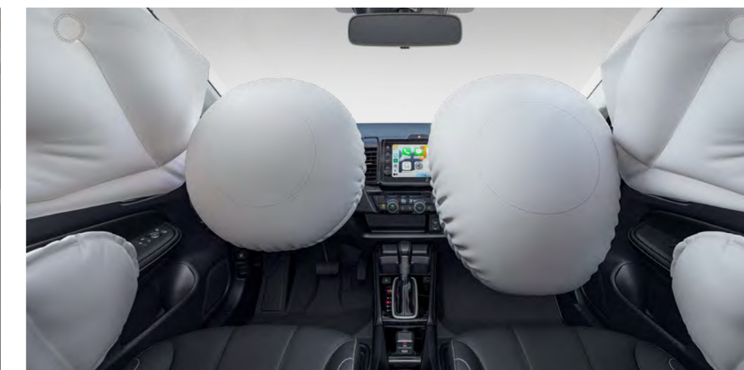
6 airbags (frontais, laterais e de cortina)