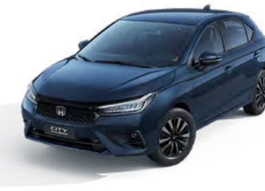
Azul Cósmico Metálico