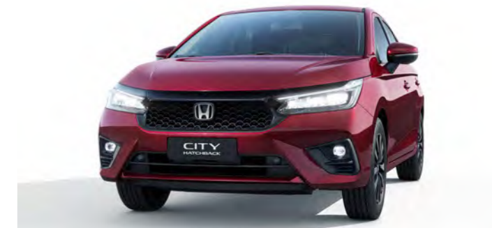
Conjunto óptico Full LED