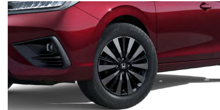
Rodas de liga leve de 16"