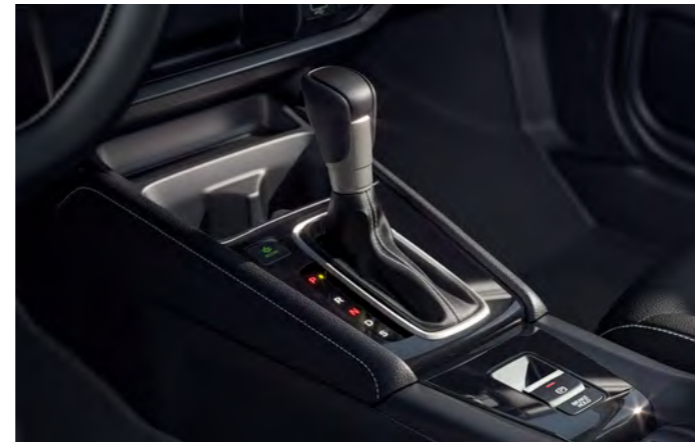
Transmissão automática tipo CVT

O paddle shift proporciona uma direção mais esportiva, pois permite ao condutor simular a troca de 7 velocidades ao alcance dos dedos , enquanto os freios a disco nas rodas garantem maior eficiência e segurança nas frenagens.