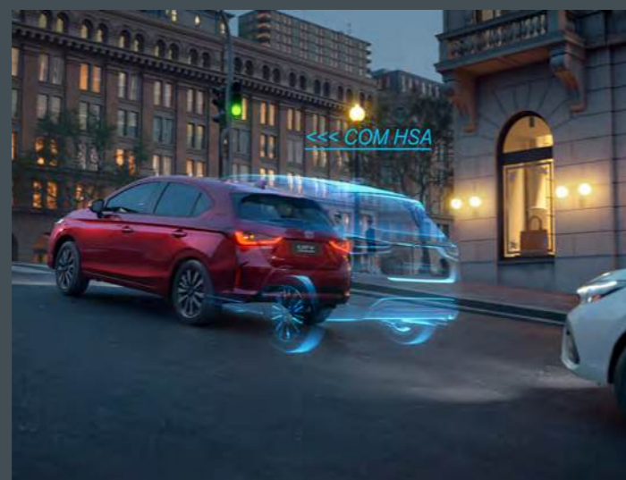
HSA - Assistente de partida em aclives