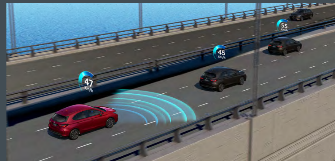
ACC™ com LSF Controle de cruzeiro adaptativo com ajuste de velocidade 2

Sistema que auxilia o motorista a manter uma distância segura em relação ao veículo à sua frente. Ideal para o dia a dia na cidade, com função para acompanhamento em baixa velocidade.