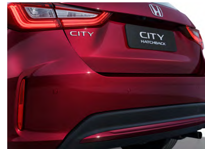
Novo para-choque traseiro