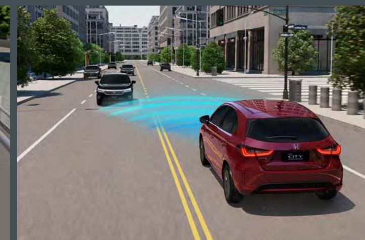
CMBS™ Sistema de Frenagem para Mitigação de Colisão 6

Sistema que detecta a saída da pista e ajusta a direção com o objetivo de evitar a sua evasão e possíveis acidentes.