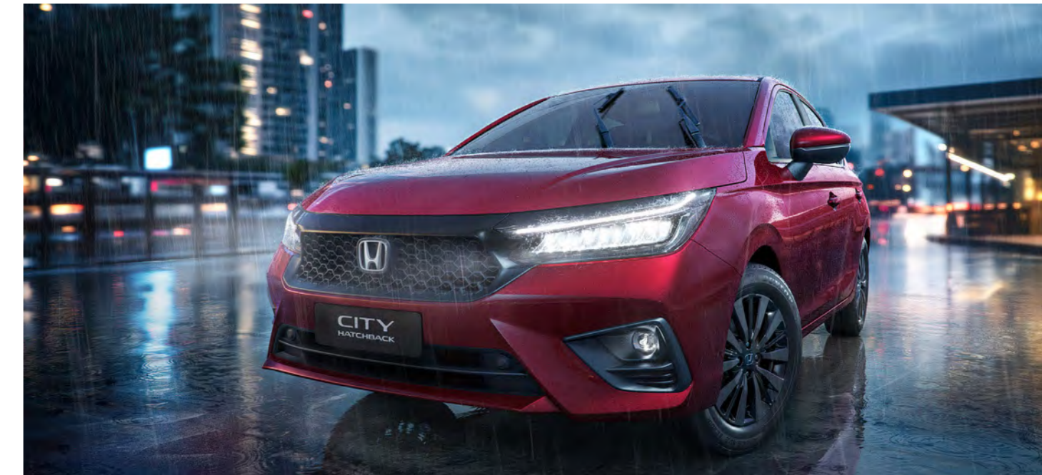
Limpador de para-brisa com função intermitente e sensor de chuva