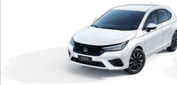
Branco Tafetá Sólido