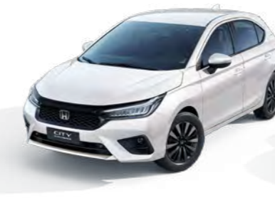
Branco Topázio Perolizado