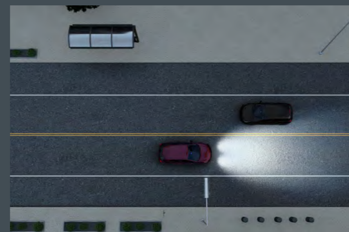
AHB™ Ajuste automático de farol 4

Sistema que detecta as faixas de rodagem e ajusta a direção, auxiliando o motorista a manter o veículo centralizado nas faixas de rodagem.