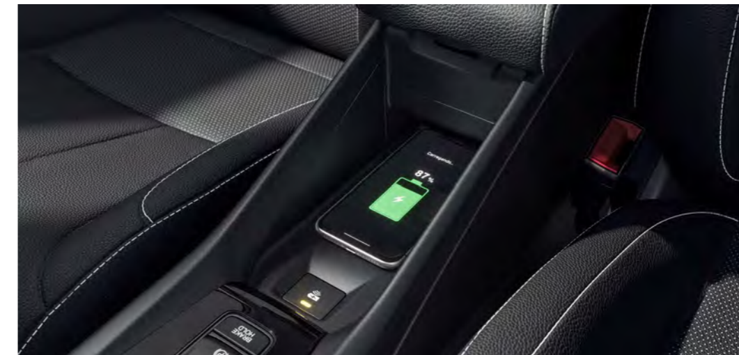
Carregador sem fio

Já o painel digital de 7" de alta definição do New City Hatchback garante melhor visibilidade e agilidade na leitura das informações do veículo.