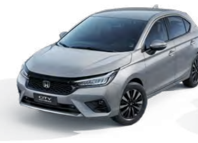
Prata Platinum Metálico