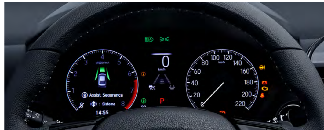
Painel Digital TFT de 7" de alta definição

Com interface sem fio para Apple CarPlay® 7 e Android Auto™7 , o multimídia 8" do New City Hatchback proporciona uma navegação mais amigável e intuitiva. Integra funções de áudio, Voice Tag, controles no volante e câmera de ré.