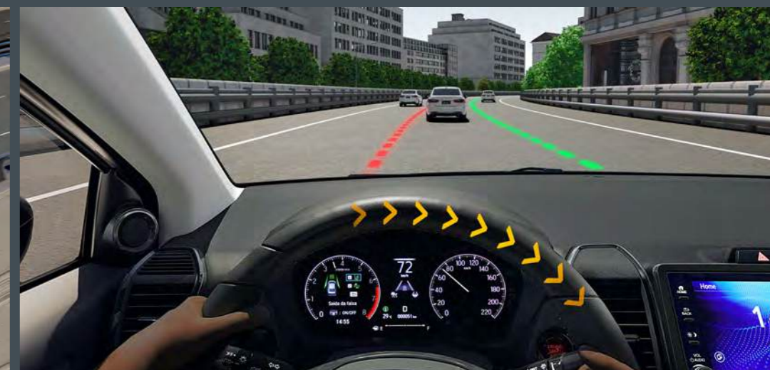
LKAS™ Sistema de permanência de faixa 3

Sistema que auxilia o motorista a manter uma distância segura em relação ao veículo à sua frente. Ideal para o dia a dia na cidade, com função para acompanhamento em baixa velocidade.