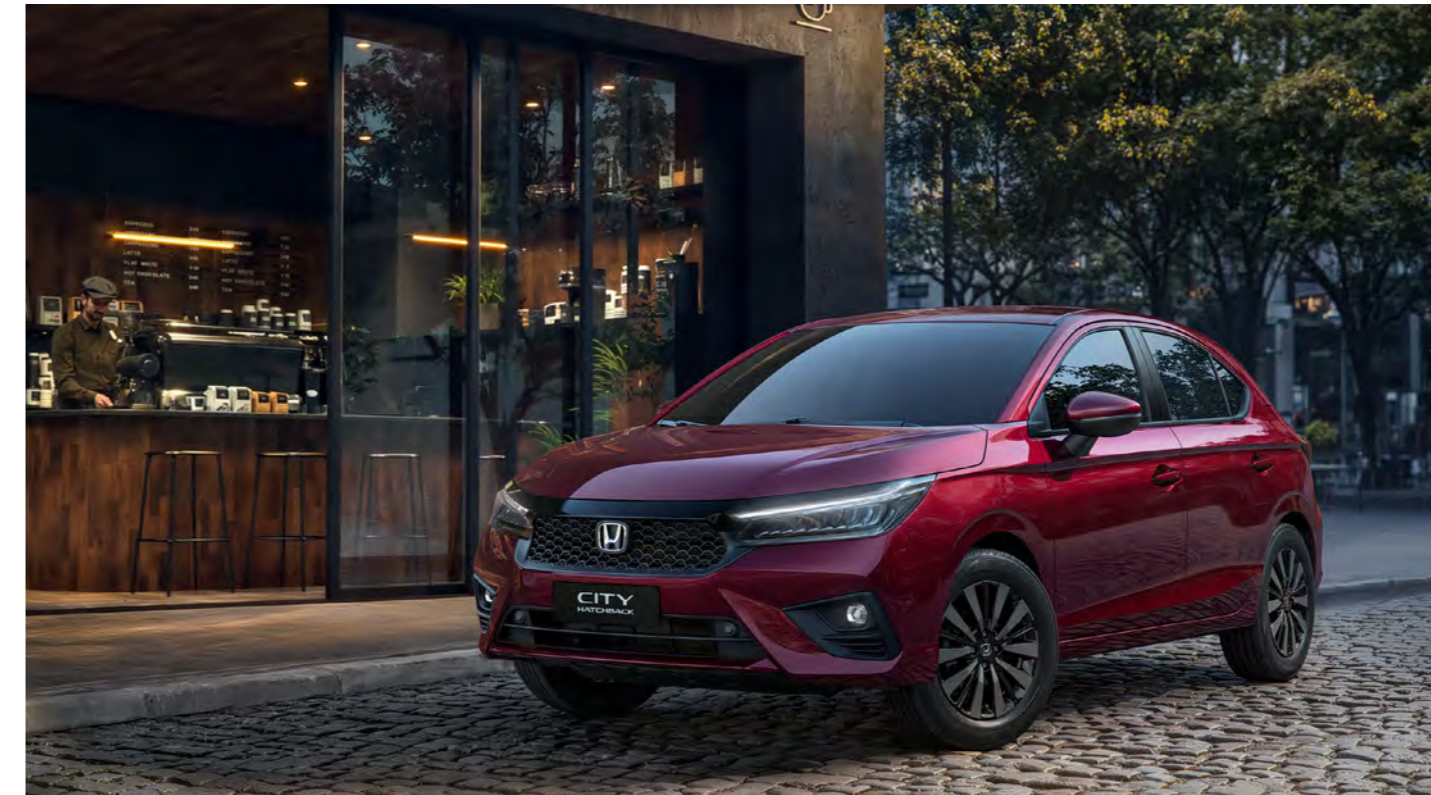
Nova grade com acabamento Black Piano

O novo para-choques em conjunto ao novo design das rodas de liga leve 16" com acabamento escurecido complementam o estilo arrojado e esportividade do New City Hatchback. Já seu interior possui acabamentos refinados que reforçam a qualidade, modernidade e conforto a bordo.