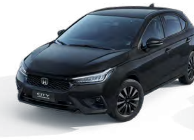
Preto Cristal Perolizado