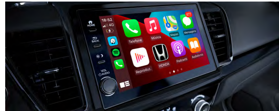
Multimídia 8" com interface para smartphones com Apple CarPlay™ e Android Auto™

Com interface sem fio para Apple CarPlay® 7 e Android Auto™7 , o multimídia 8" do New City Hatchback proporciona uma navegação mais amigável e intuitiva. Integra funções de áudio, Voice Tag, controles no volante e câmera de ré.