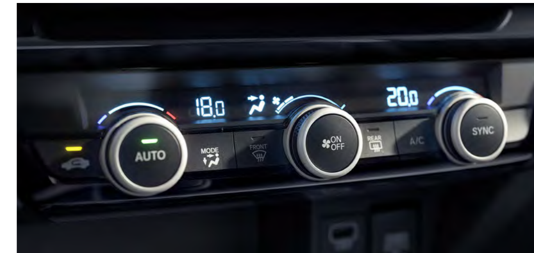
Sistema de ar-condicionado Dual Zone

O console central apresenta um novo carregador sem fio para smartphones para sua maior conveniência. Conta também com 2 portas USB dianteiras tipo A e 2 portas USB traseiras tipo C.