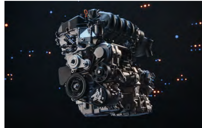
Motor 1.5L DOHC VTEC com Injeção Direta

Sua transmissão automática do tipo CVT (contínua variável) também garante uma condução mais suave com menos consumo de combustível.